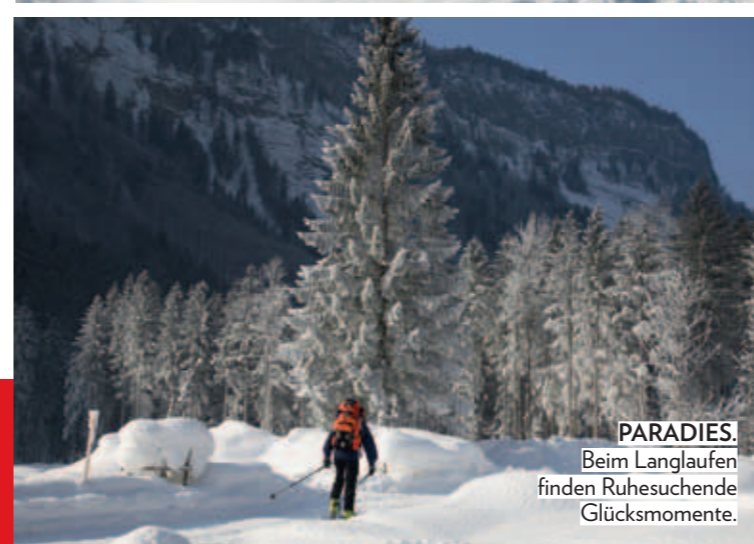
PARADIES. Beim Langlaufen finden Ruhesuchende Glücksmomente.