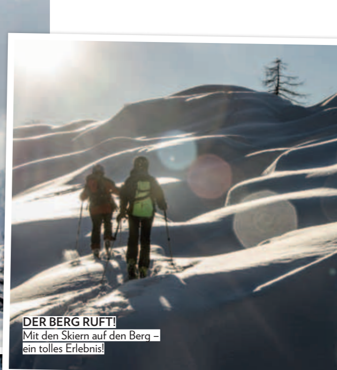
DER BERG RUFT! Mit den Skiern auf den Berg – ein tolles Erlebnis!