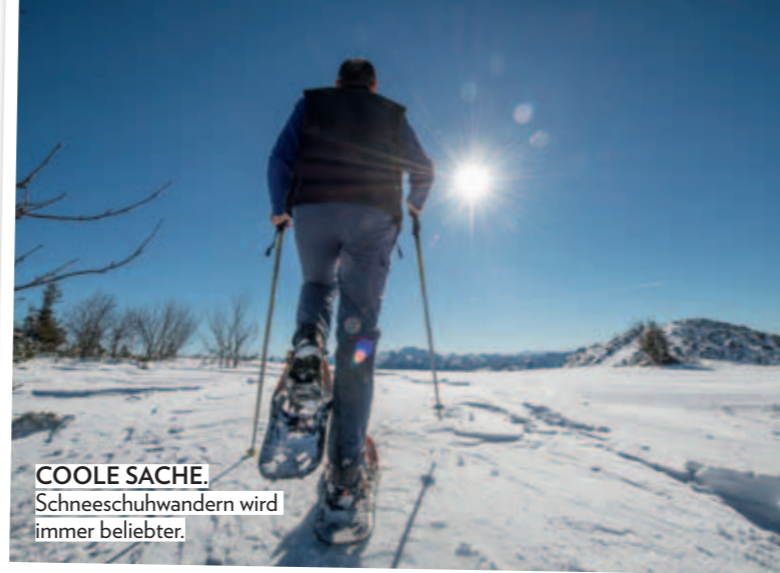
COOLE SACHE. Schneeschuhwandern wird immer beliebter.

Die Stille des Salzkammerguts und endlose Kilometer unberührte weiße Pracht kann man beim Schneeschuhwandern am Feuerkogel genießen. Die-